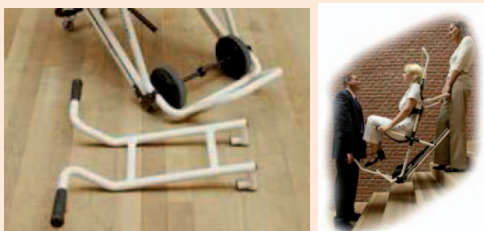
Système de portage avant